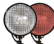
фары на СИМ