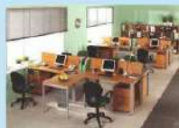
Стол на P-образных опорах

Основные достоинства металлокаркаса с опорами P-образной формы — высокая жесткость и универсальность конструкции. На сегодняшний день они являются самыми прочными и надежными!